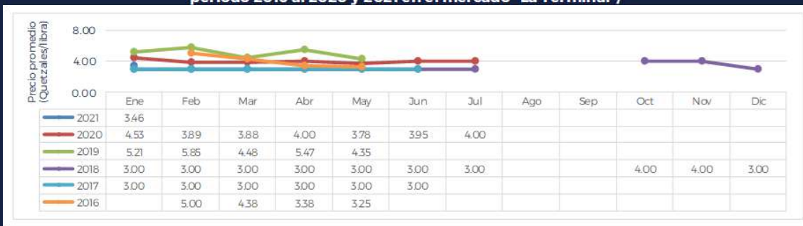
Gráfica del precio promedio mensual de la Cebolla Blanca, mediana, de primera calidad período 2016 al 2020 y 2021 en el mercado "La Terminal" 2