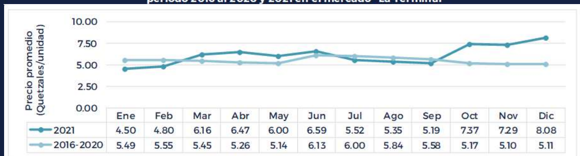
Gráfica del precio promedio mensual del Repollo mediano de primera calidad período 2016 al 2020 y 2021 en el mercado "La Terminal"