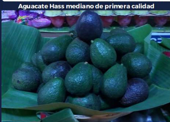
Aguacate Hass mediano de primera calidad