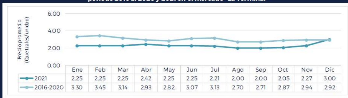
Gráfica del precio promedio mensual del Apio mediano de primera calidad período 2016 al 2020 y 2021 en el mercado "La Terminal"