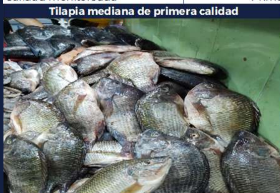
Tilapia mediana de primera calidad