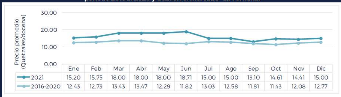
Gráfica del precio promedio mensual de la Zanahoria con hojas, mediana, de primera calidad período 2016 al 2020 y 2021 en el mercado "La Terminal"