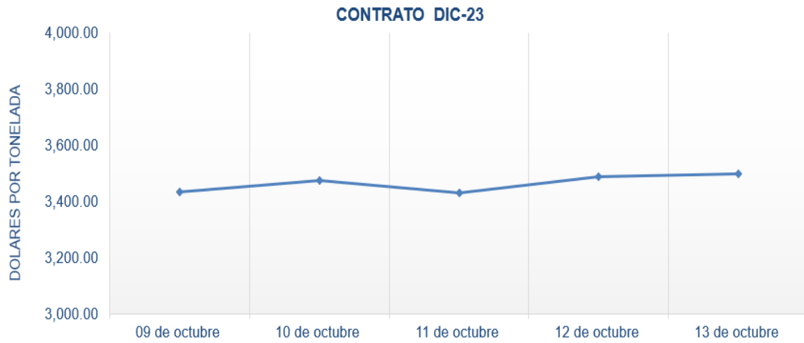
Figura 7. Comportamiento de precios a futuro de cacao según contrato