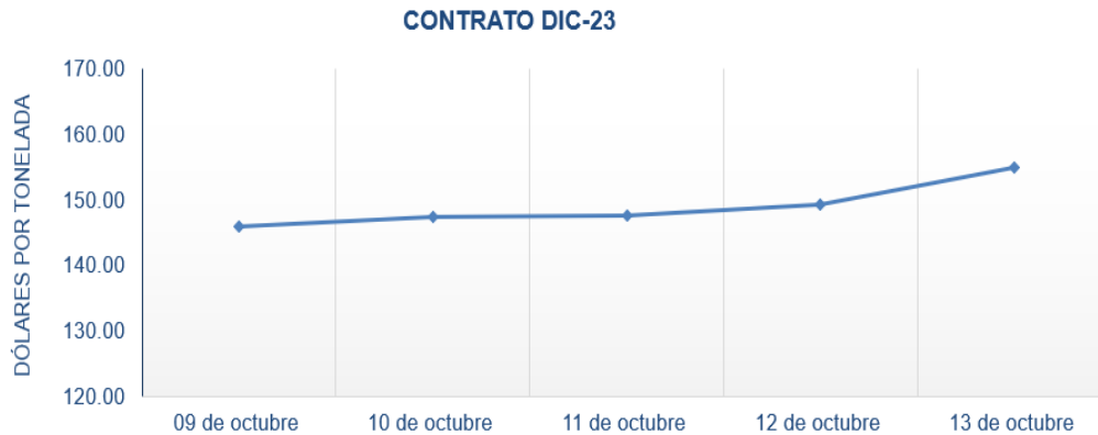
Figura 5. Comportamiento de precios a futuro de café según contrato