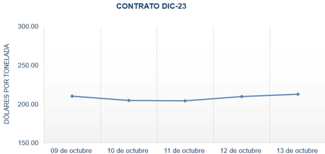
Figura 2. Comportamiento de precios a futuro de trigo según contrato