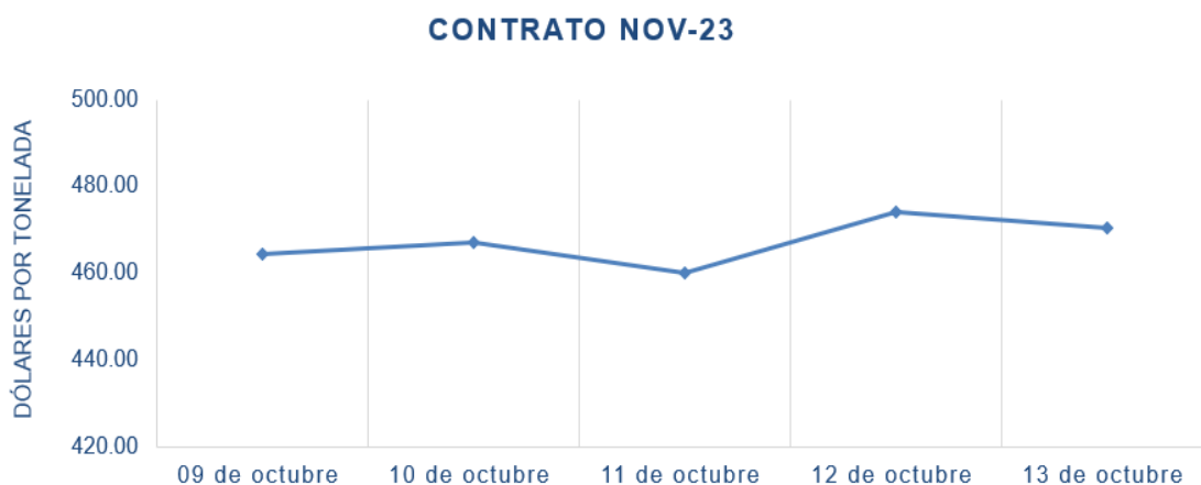
Figura 3. Comportamiento de precios a futuro de soya según contrato