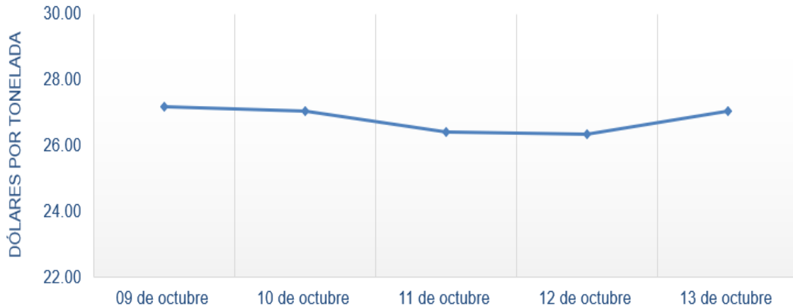
Figura 6. Comportamiento de precios a futuro de azúcar según contrato CONTRATO OCT-23