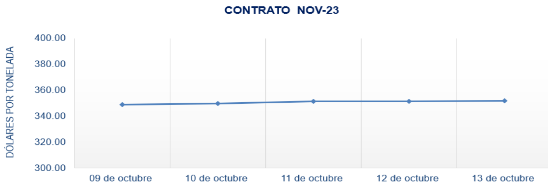
Figura 4. Comportamiento de precios a futuro de arroz según contrato