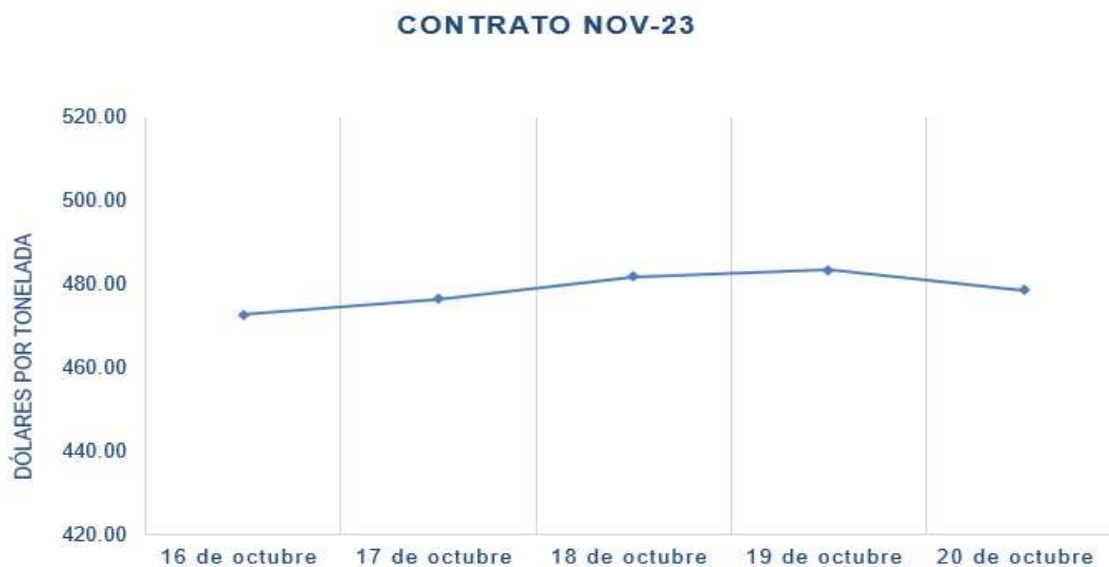
Figura 3. Comportamiento de precios a futuro de soya según contrato