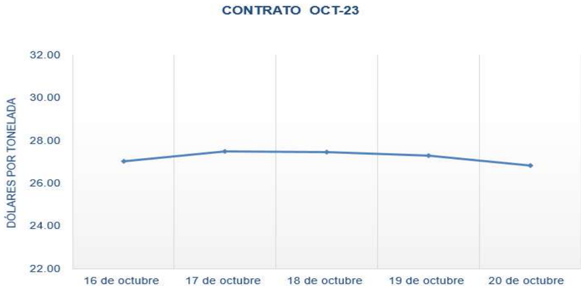
Figura 6. Comportamiento de precios a futuro de Azúcar según contrato