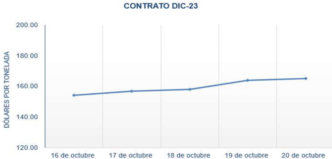
Figura 5. Comportamiento de precios a futuro de café según contrato