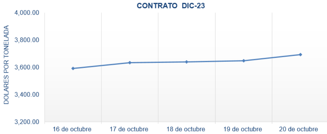
Figura 7. Comportamiento de precios a futuro de cacao según contrato