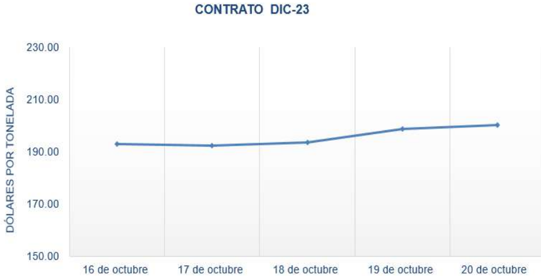
Figura 1. Comportamiento de precios a futuro de maíz según contrato