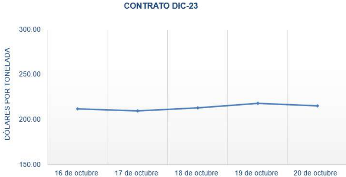
Figura 2. Comportamiento de precios a futuro de trigo según contrato