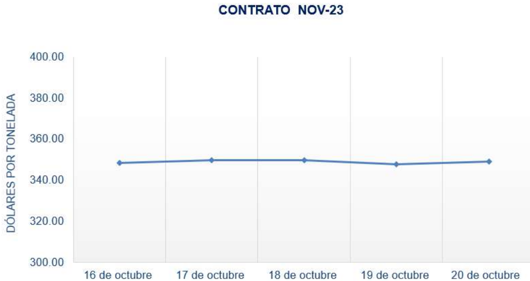
Figura 4. Comportamiento de precios a futuro de arroz según contrato