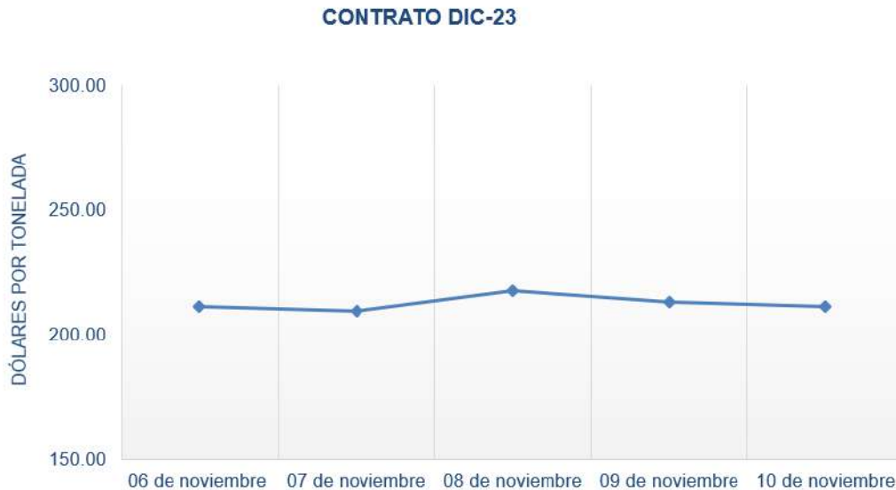
Figura 2. Comportamiento de precios a futuro de trigo según contrato