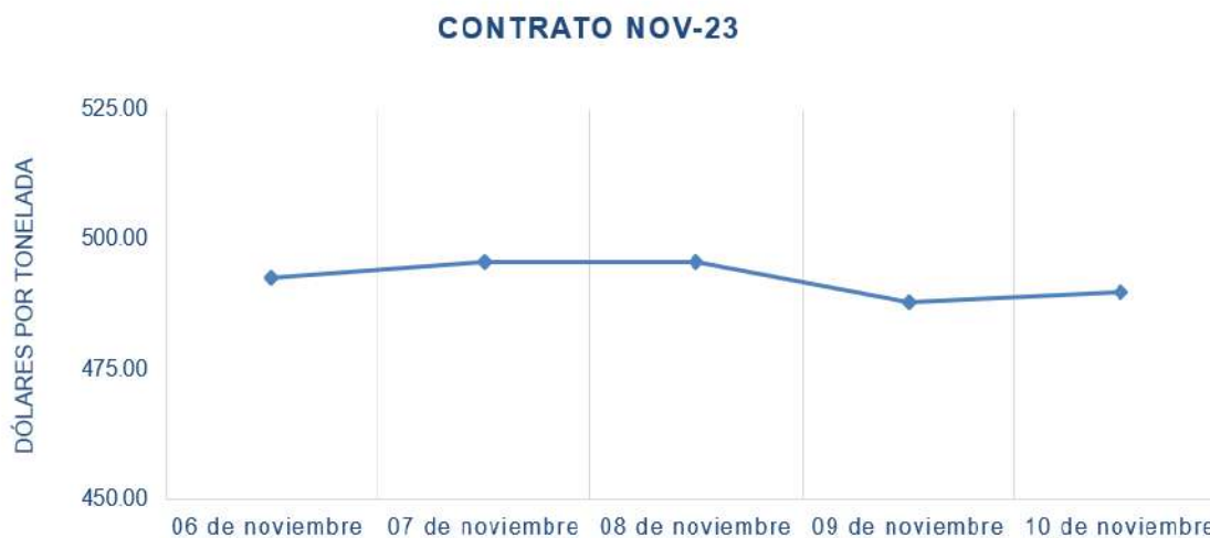
Figura 3. Comportamiento de precios a futuro de soya según contrato