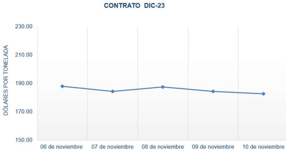
Figura 1. Comportamiento de precios a futuro de maíz según contrato