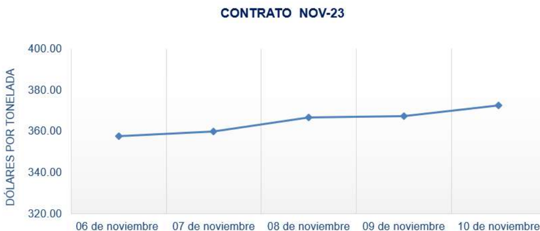
Figura 4. Comportamiento de precios a futuro de arroz según contrato