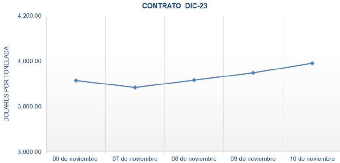
Figura 7. Comportamiento de precios a futuro de cacao según contrato