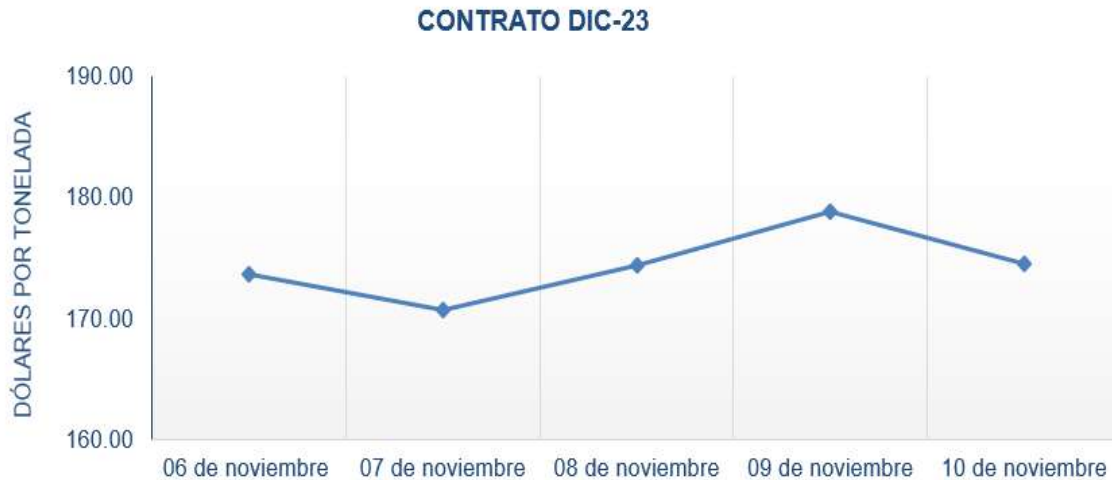
Figura 5. Comportamiento de precios a futuro de café según contrato