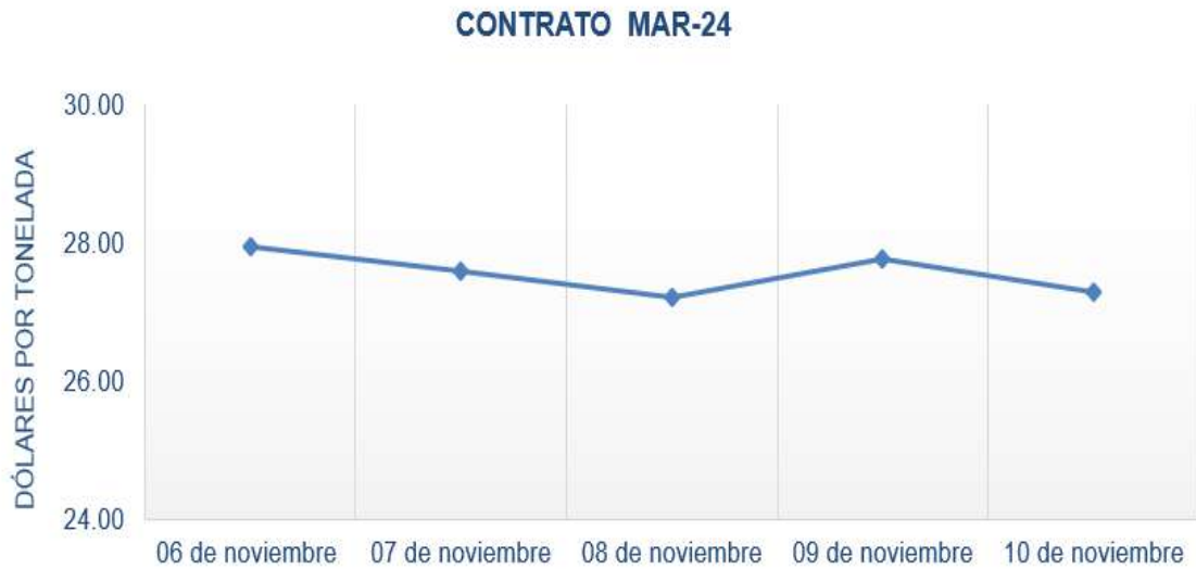
Figura 6. Comportamiento de precios a futuro de azúcar según contrato

Fuente: Planeamiento con datos del CME Group.