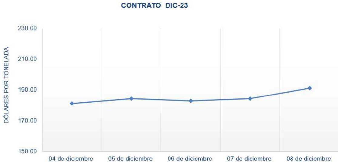
Figura 1. Comportamiento de precios a futuro de maíz según contrato