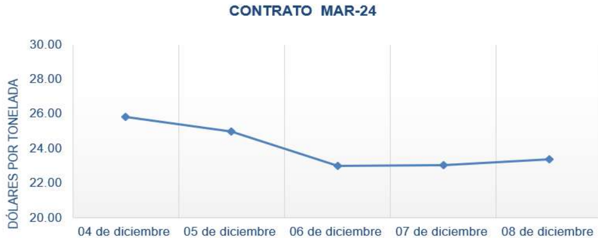
Figura 6. Comportamiento de precios a futuro de azúcar según contrato