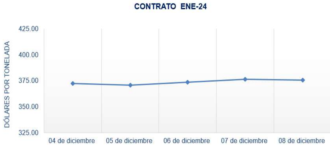
Figura 4. Comportamiento de precios a futuro de arroz según contrato