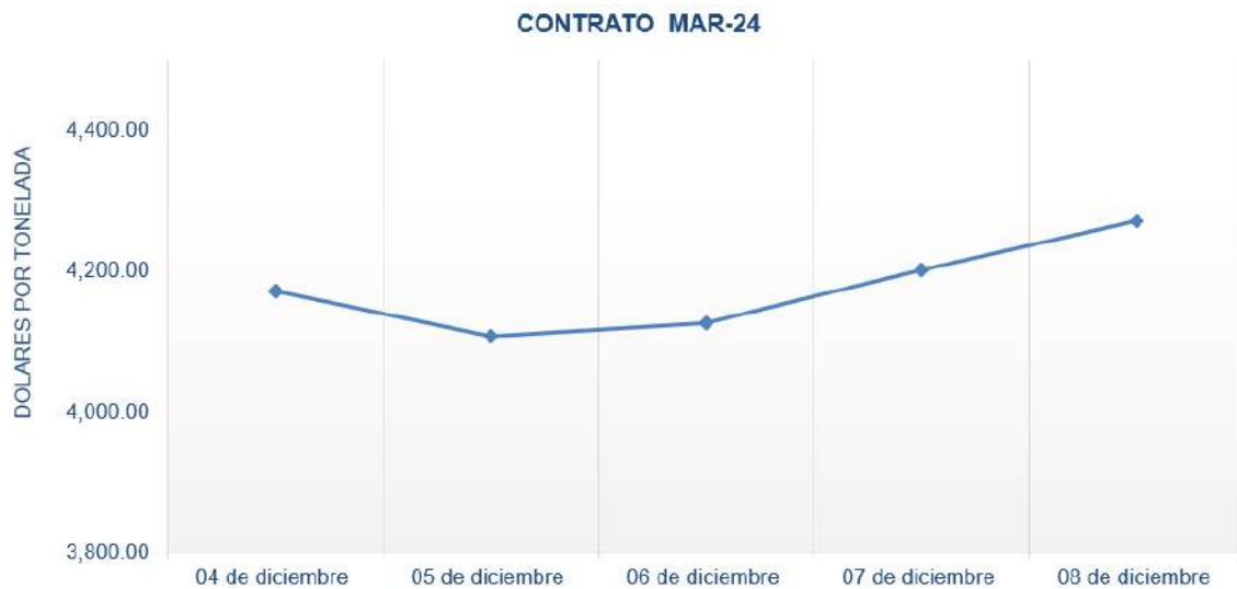
Figura 7. Comportamiento de precios a futuro de cacao según contrato