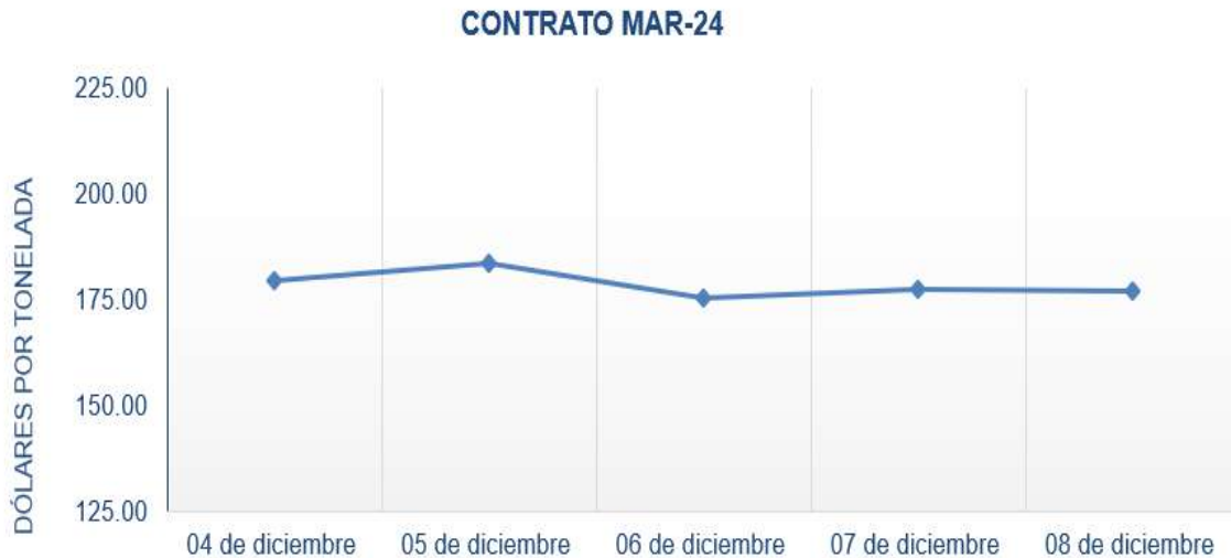
Figura 5. Comportamiento de precios a futuro de Café según contrato