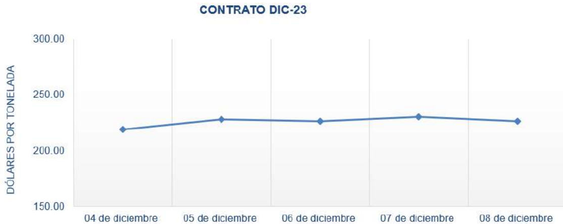
Figura 2. Comportamiento de precios a futuro de trigo según contrato