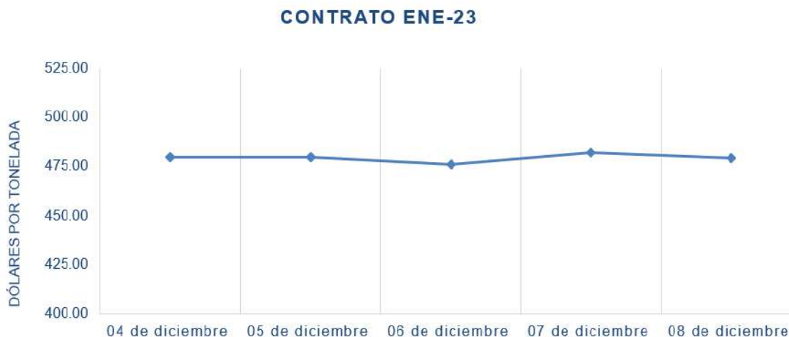
Figura 3. Comportamiento de precios a futuro de soya según contrato