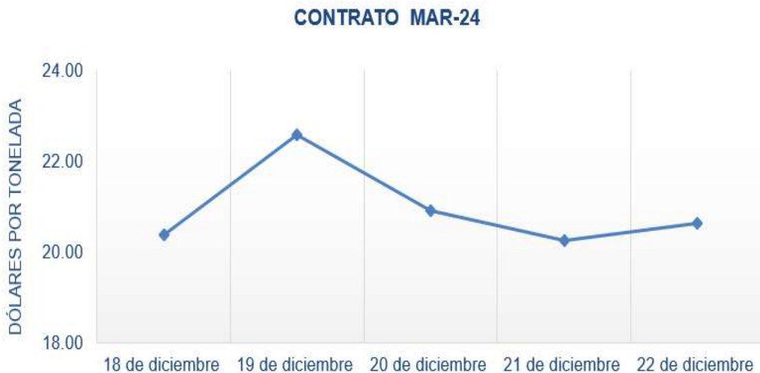
Figura 6. Comportamiento de precios a futuro de azúcar según contrato