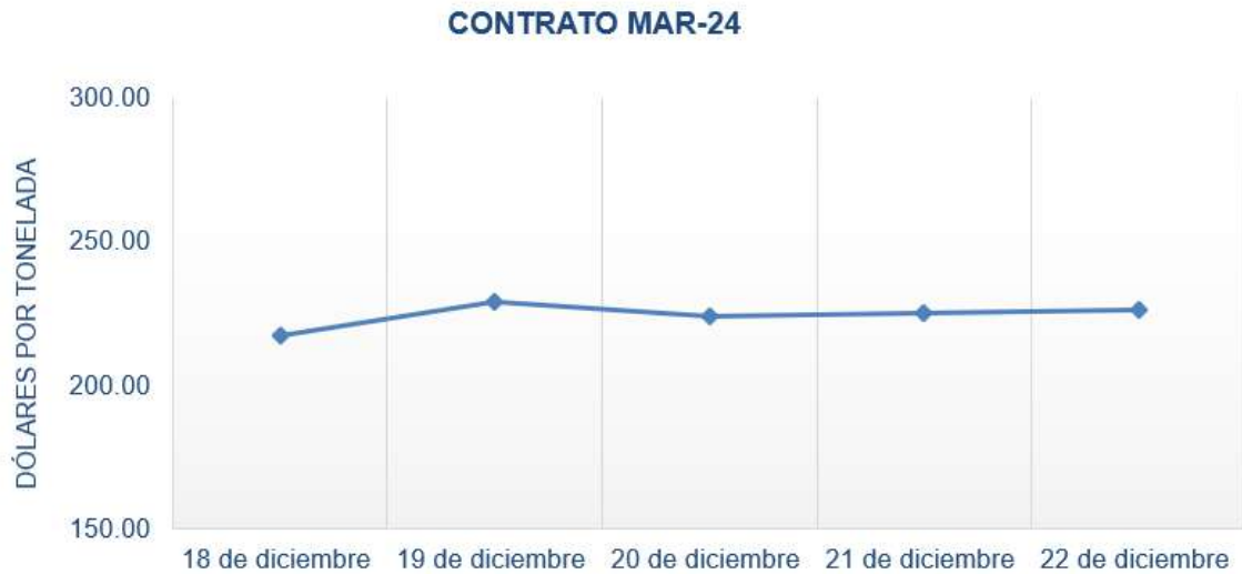
Figura 2. Comportamiento de precios a futuro de Trigo según contrato