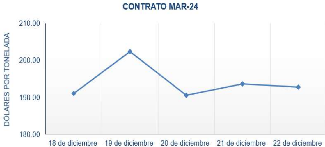
Figura 5. Comportamiento de precios a futuro de café según contrato