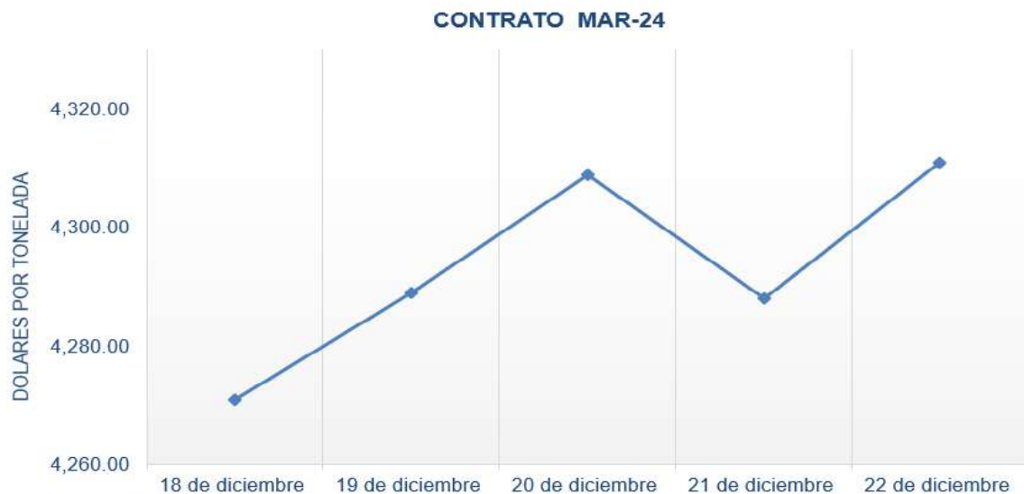
Figura 7. Comportamiento de precios a futuro de cacao según contrato