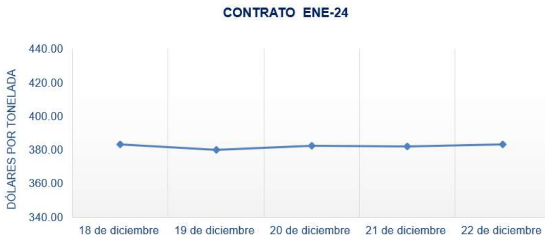
Figura 4. Comportamiento de precios a futuro de arroz según contrato