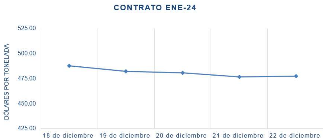
Figura 3. Comportamiento de precios a futuro de soya según contrato