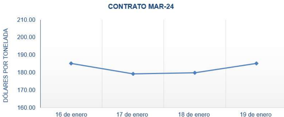
Figura 6. Comportamiento de precios a futuro de café según contrato