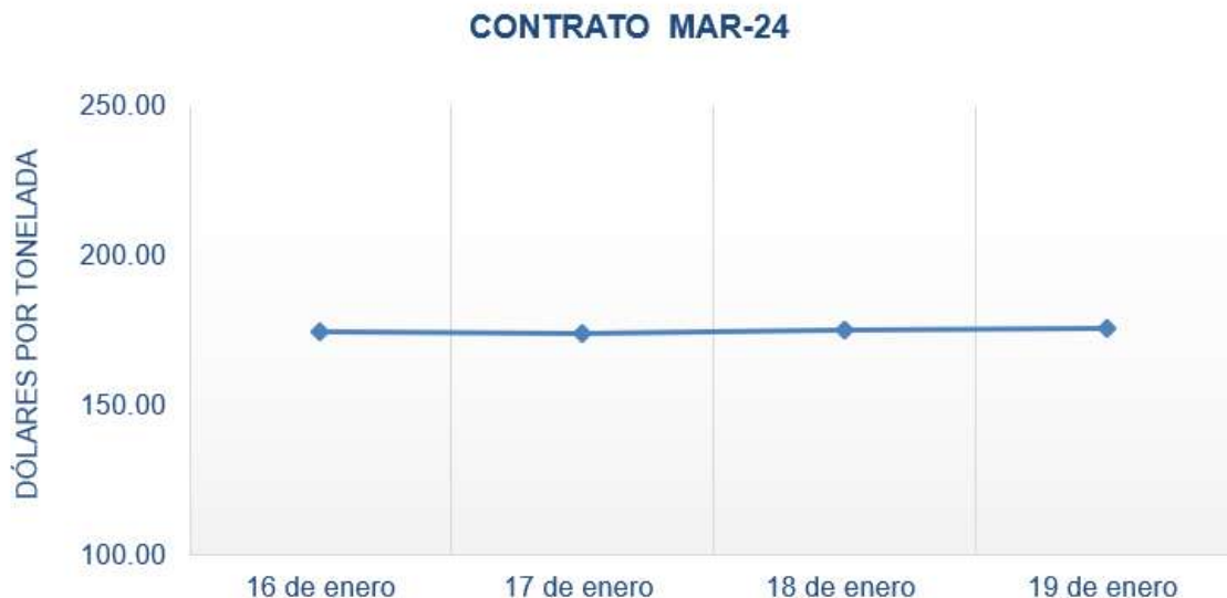
Figura 1. Comportamiento de precios a futuro de maíz según contrato