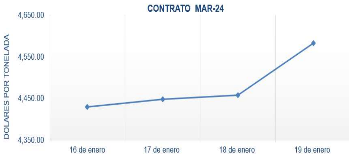
Figura 8. Comportamiento de precios a futuro de cacao según contrato