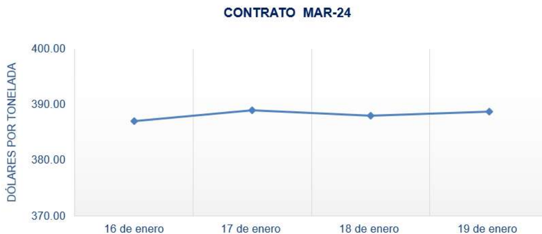
Figura 5. Comportamiento de precios a futuro de arroz según contrato