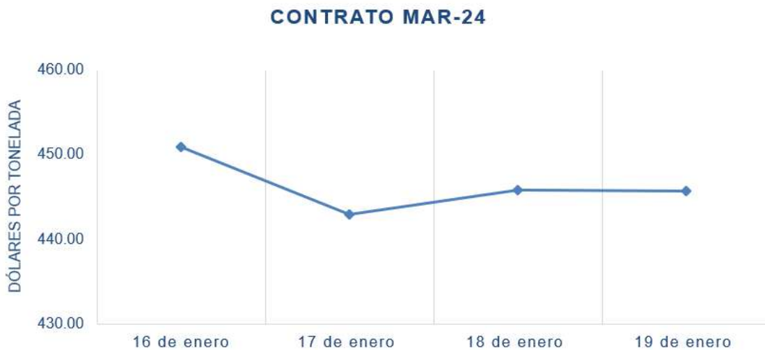
Figura 4. Comportamiento de precios de futuro de soya según contrato en la bolsa de Chicago (CBOT)