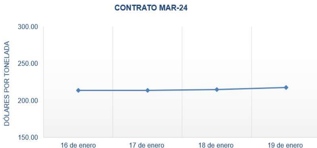
Figura 3. Comportamiento de precios a futuro de trigo según contrato