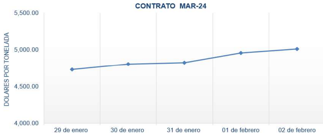
Figura 8. Comportamiento de precios a futuro de cacao según contrato