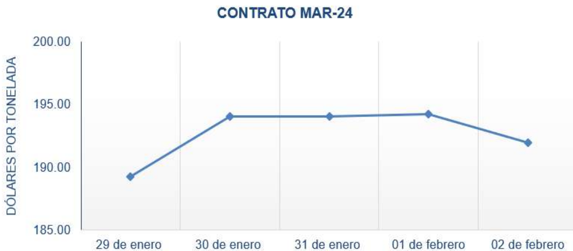
Figura 5. Comportamiento de precios a futuro de café según contrato