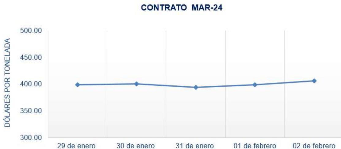
Figura 4. Comportamiento de precios a futuro de arroz según contrato