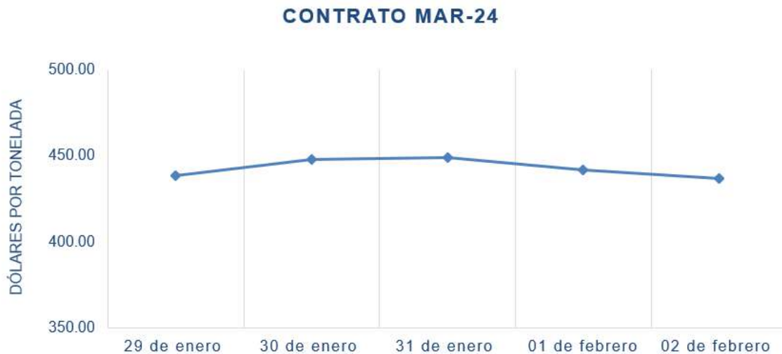
Figura 3. Comportamiento de precios de futuro de soya según contrato en la bolsa de Chicago (CBOT)