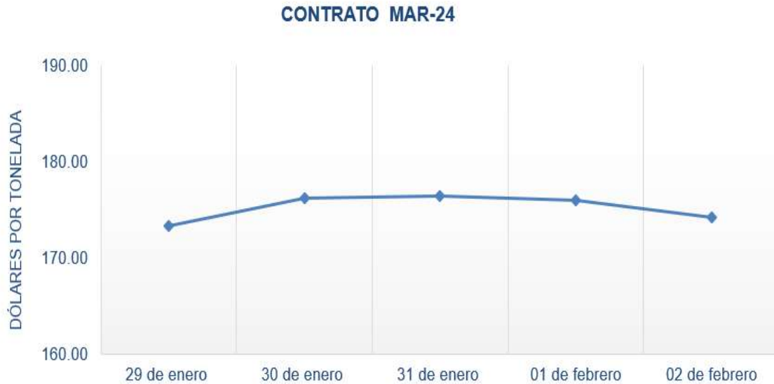
Figura 1. Comportamiento de precios a futuro de maíz según contrato