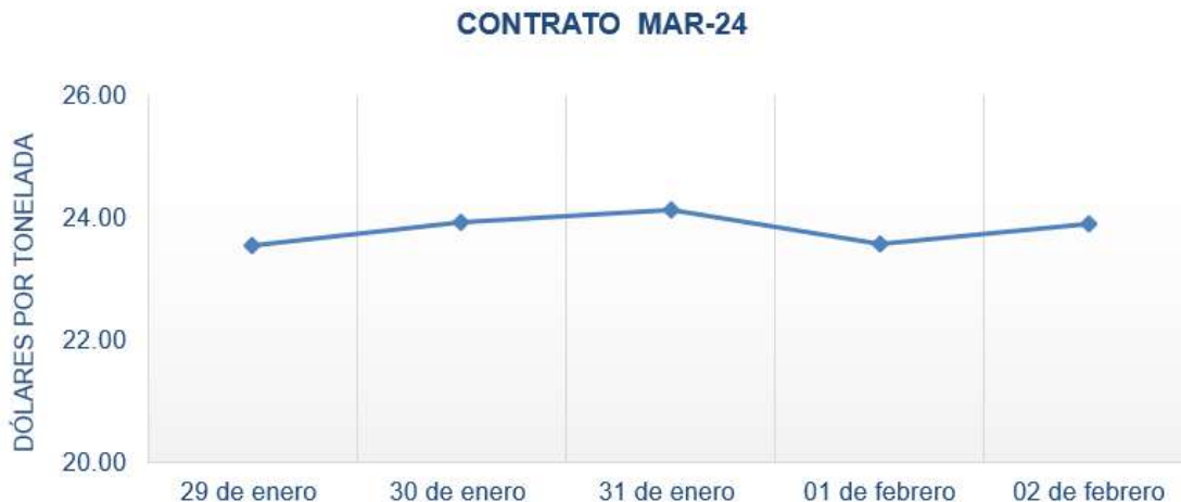
Figura 7. Comportamiento de precios a futuro de azúcar según contrato