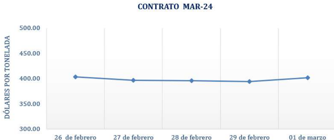
Figura 4. Comportamiento de precios a futuro de arroz según contrato a Mar-24