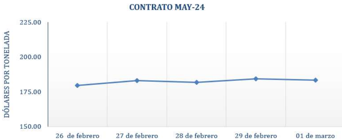
Figura 5. Comportamiento de precios a futuro de café según contrato a May-24