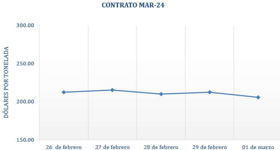
Figura 2. Comportamiento de precios a futuro de trigo según contrato a Mar-24