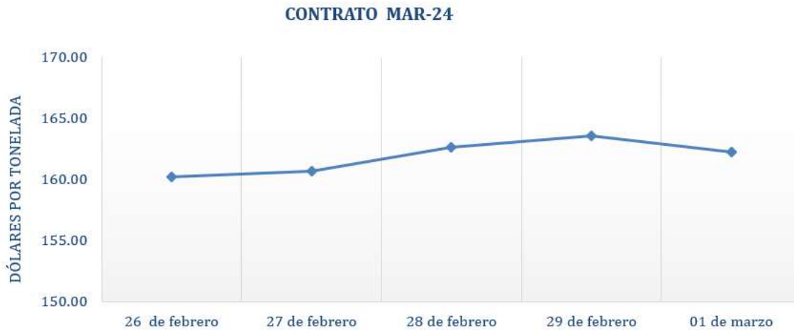
Figura 1. Comportamiento de precios a futuro de maíz según contrato a Mar-24.