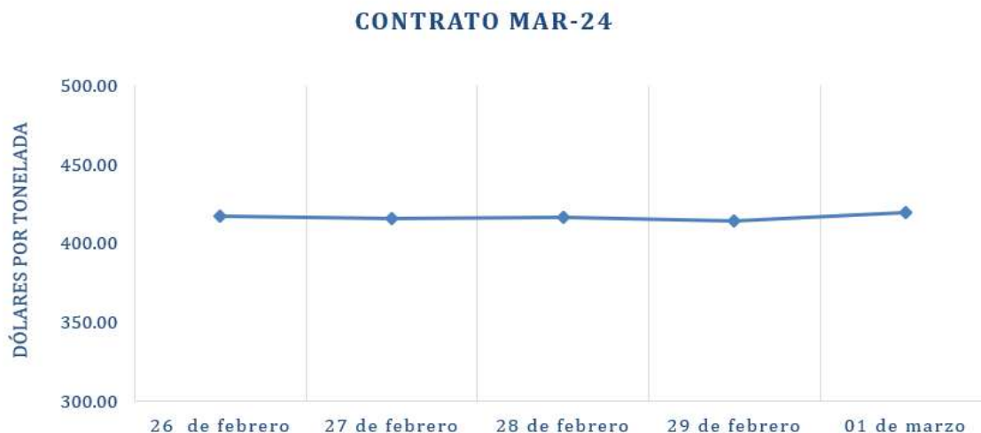
Figura 3. Comportamiento de precios de futuro de soya según contrato a Mar-24

Fuente: Planeamiento con datos del CME Group.