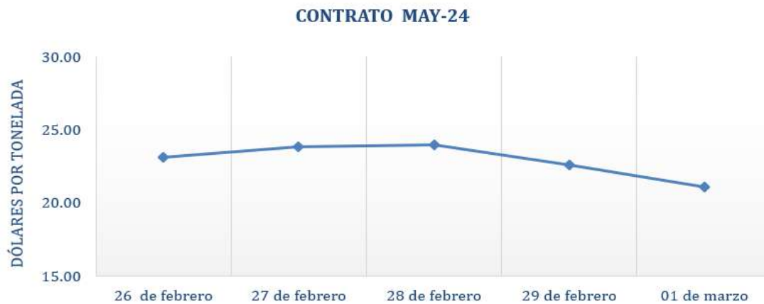
Figura 7. Comportamiento de precios a futuro de azúcar según contrato a mayo 2024.