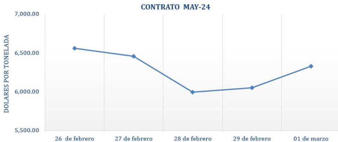
Figura 8. Comportamiento de precios a futuro de cacao según contrato a mayo 2024.