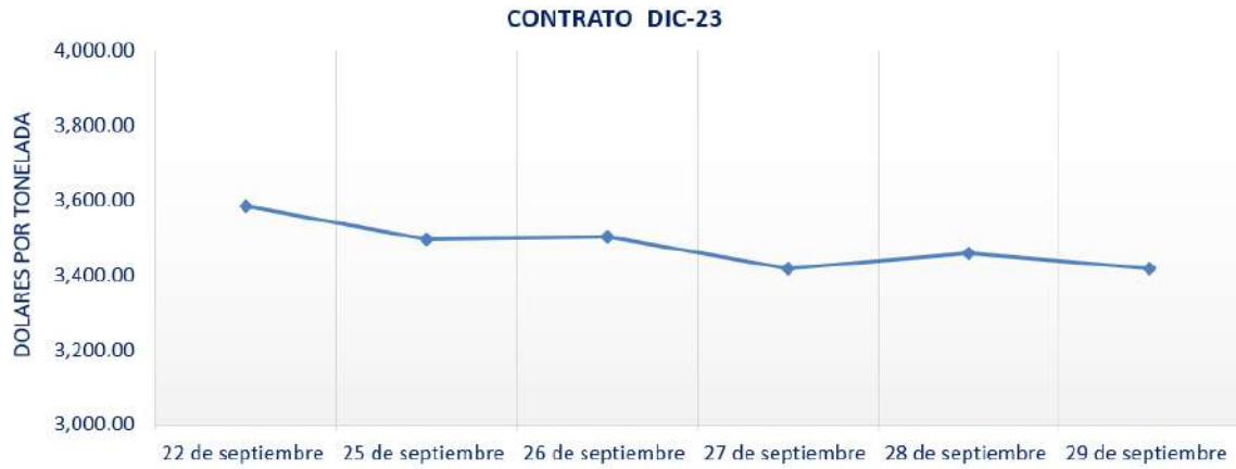
Figura 7. Comportamiento de precios a futuro de cacao según contrato