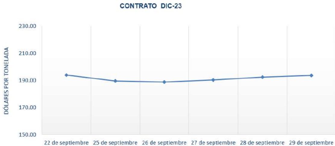
Figura 1. Comportamiento de precios a futuro de Maíz según contrato