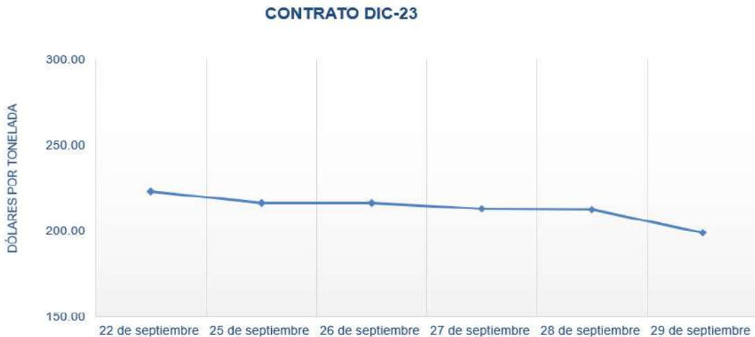
Figura 2. Comportamiento de precios a futuro de Trigo según contrato