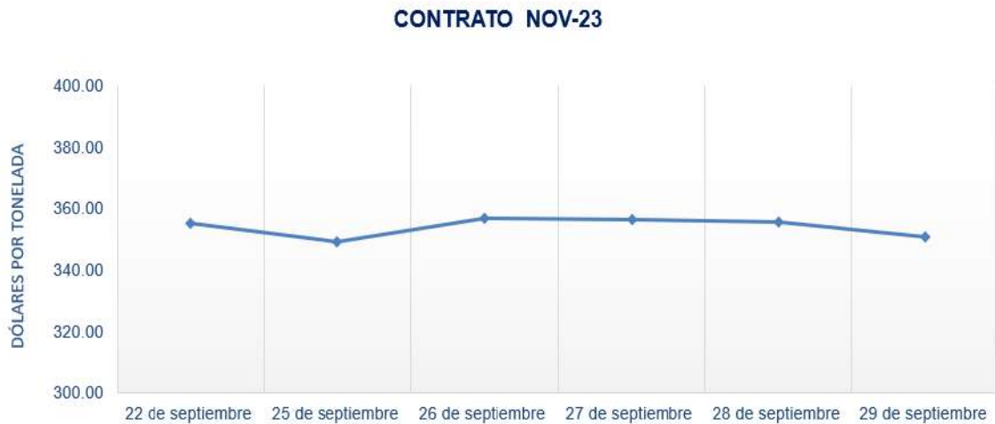
Figura 4. Comportamiento de precios a futuro de arroz según contrato