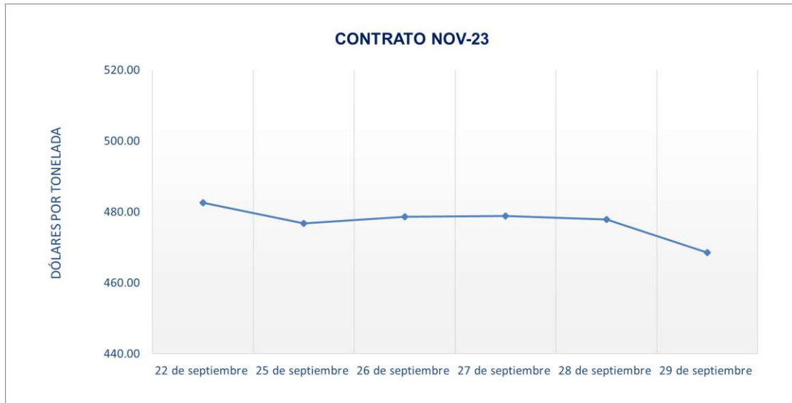
Figura 3. Comportamiento de precios a futuro de Soya según contrato