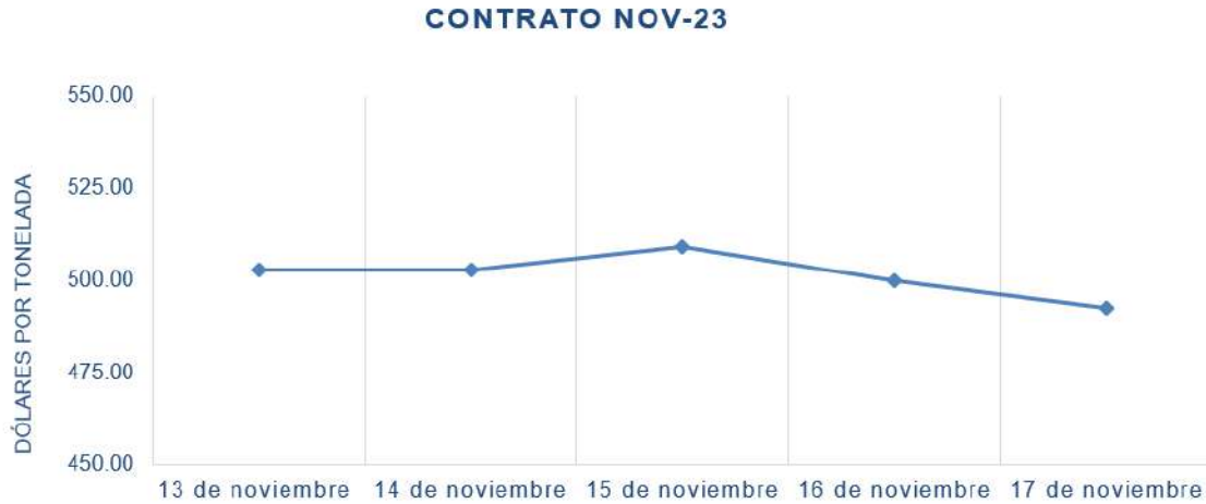
Figura 3. Comportamiento de precios a futuro de soya según contrato