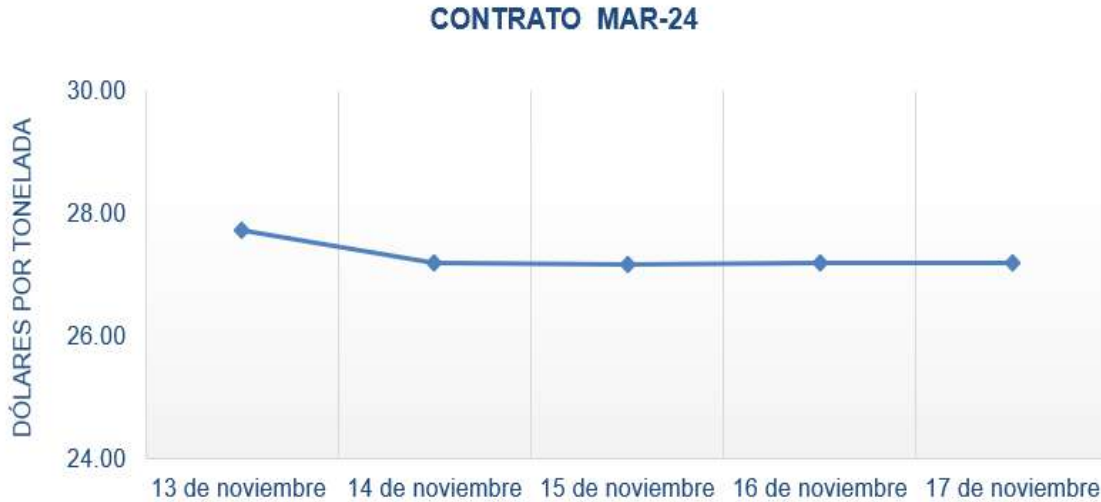
Figura 6. Comportamiento de precios a futuro de azúcar según contrato