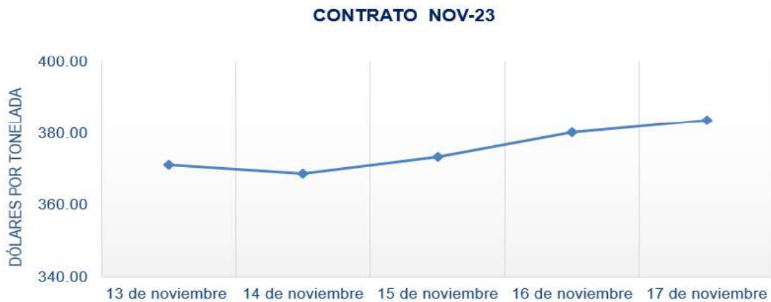
Figura 4. Comportamiento de precios a futuro de arroz según contrato