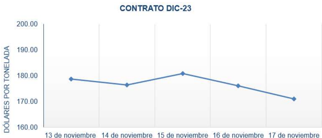
Figura 5. Comportamiento de precios a futuro de café según contrato