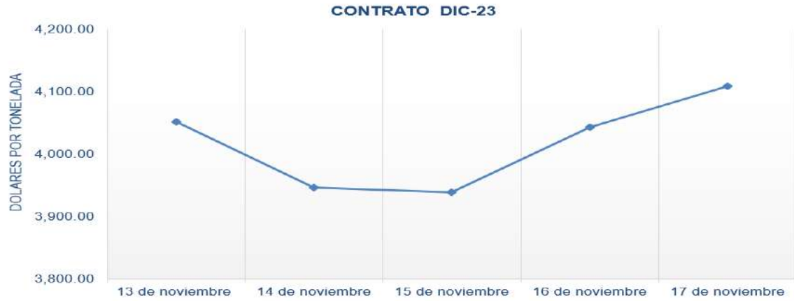
Figura 7. Comportamiento de precios a futuro de cacao según contrato