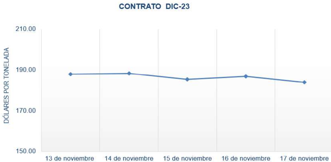
Figura 1. Comportamiento de precios a futuro de maíz según contrato