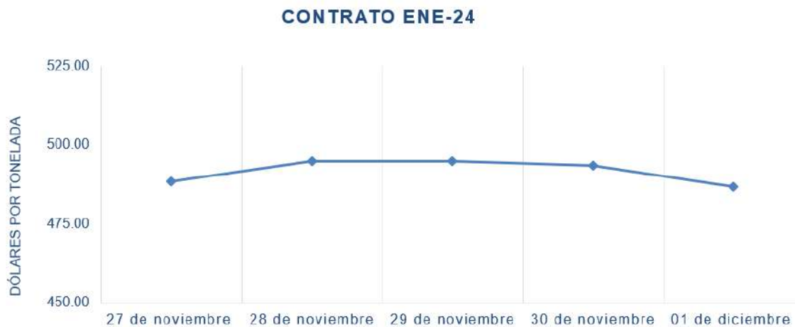
Figura 5. Comportamiento de precios a futuro de soya según contrato