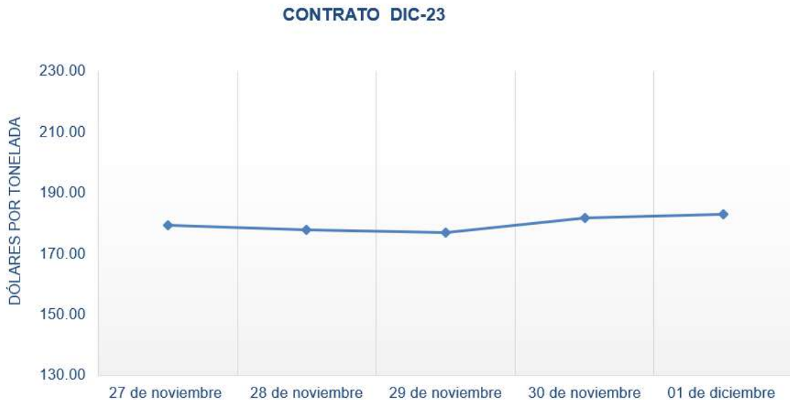
Figura 1. Comportamiento de precios a futuro de maíz según contrato