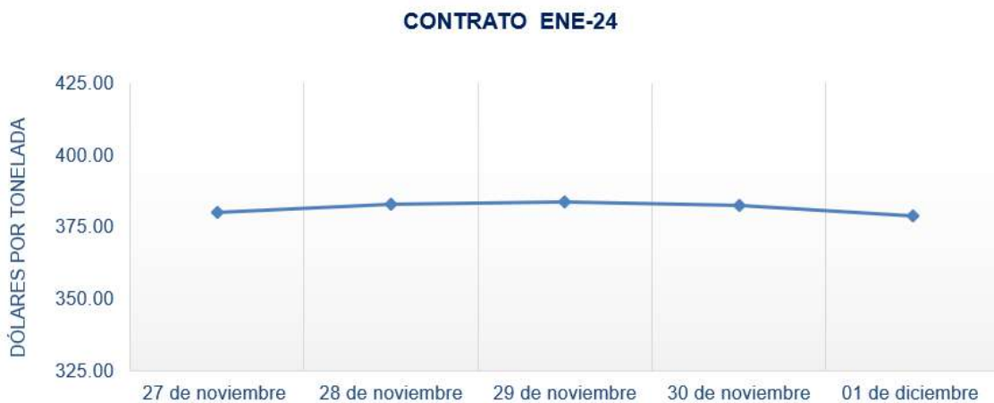
Figura 3. Comportamiento de precios a futuro de arroz según contrato