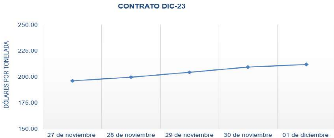
Figura 2. Comportamiento de precios a futuro de Trigo según contrato