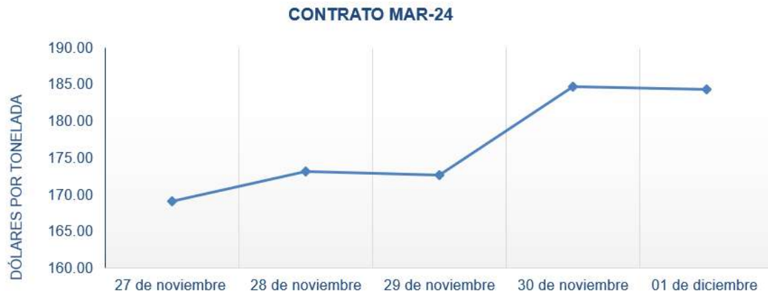
Figura 4. Comportamiento de precios a futuro de café según contrato