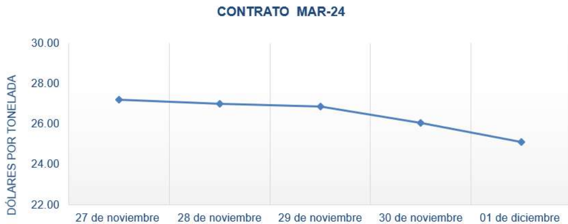
Figura 5. Comportamiento de precios a futuro de azúcar según contrato