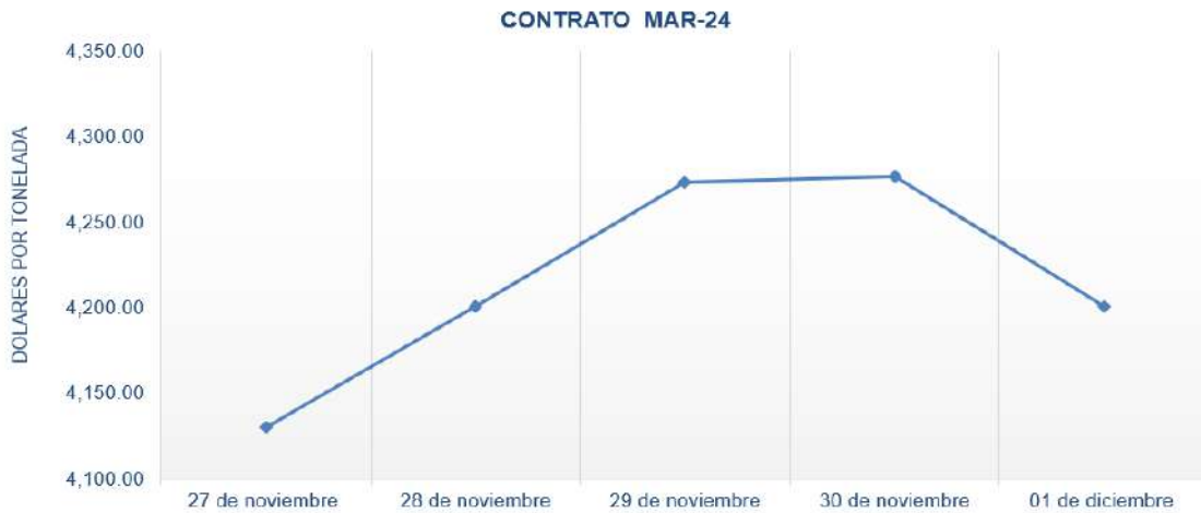
Figura 6. Comportamiento de precios a futuro de cacao según contrato