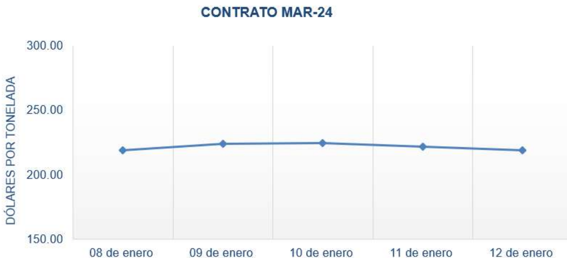
Figura 2. Comportamiento de precios a futuro de trigo según contrato