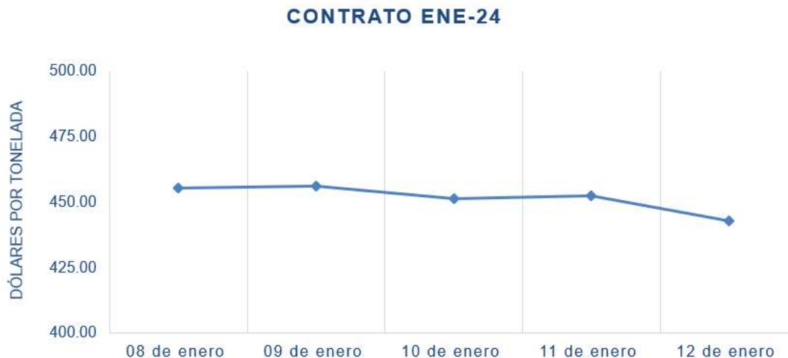
Figura 3. Comportamiento de precios a futuro de soya según contrato