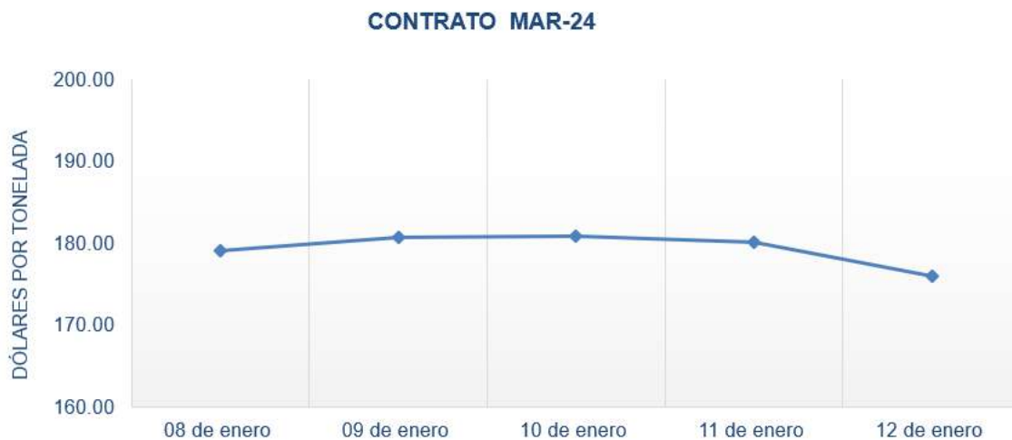
Figura 1. Comportamiento de precios a futuro de maíz según contrato