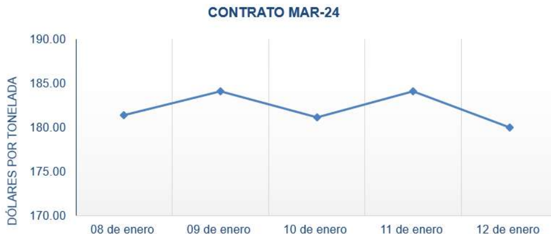
Figura 5. Comportamiento de precios a futuro de café según contrato