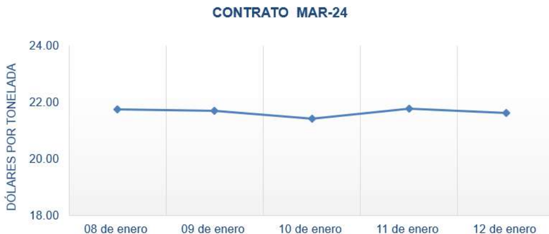
Figura 6. Comportamiento de precios a futuro de azúcar según contrato