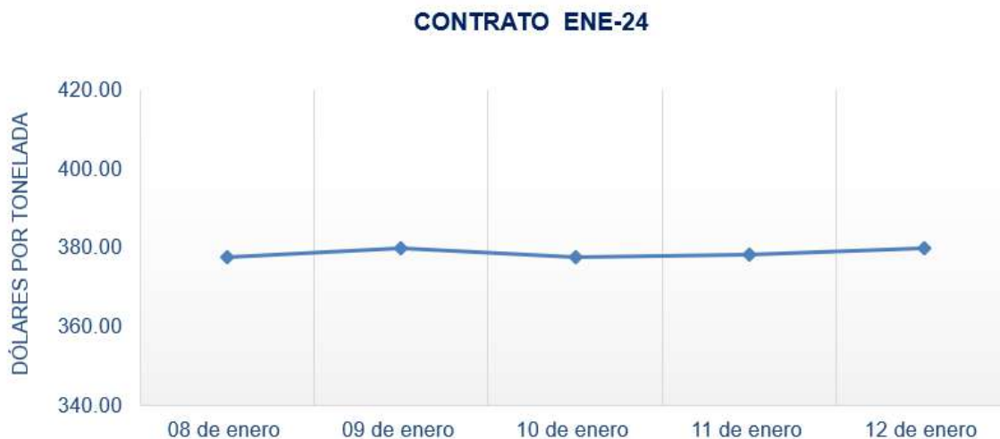
Figura 4. Comportamiento de precios a futuro de arroz según contrato