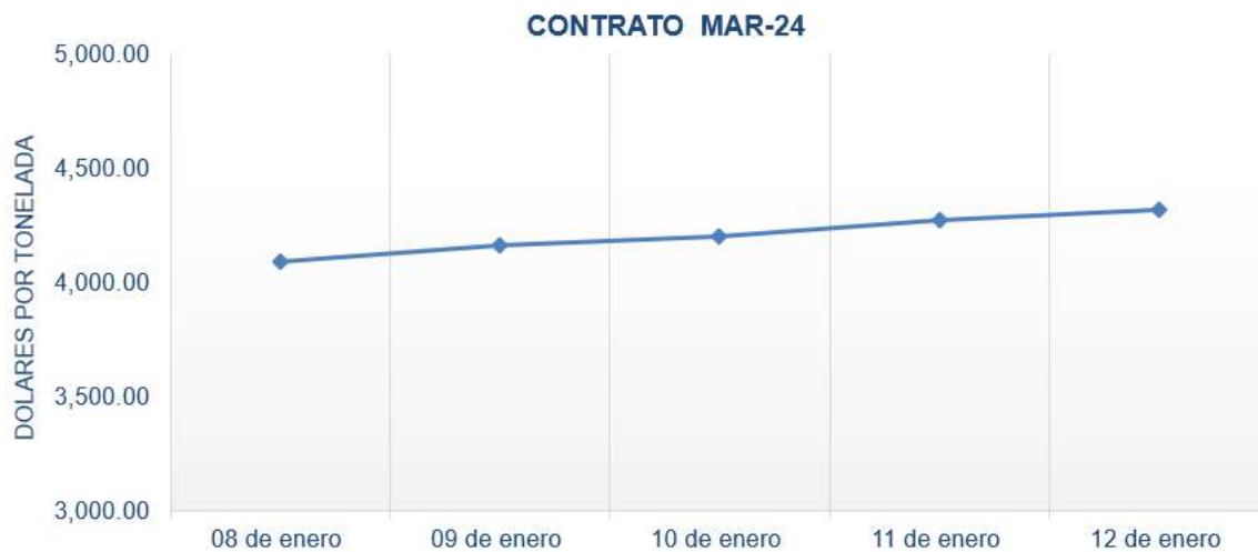
Figura 7. Comportamiento de precios a futuro de cacao según contrato