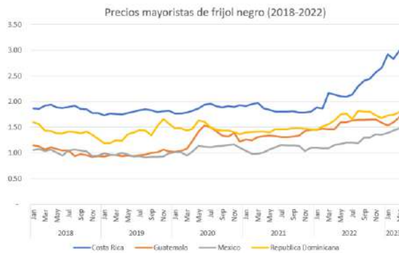
Gráfica 3. Evolución del precio del frijol negro (US$/Kg)

Nota: 1/Frijol negro. CR en 1KG.; GT y RD en QQ (100 Libras); MX en KG.; 2/MX variedad bola.