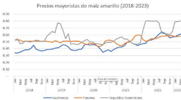
Gráfica 5. Evolución del precio del maíz amarillo (US$/Kg)

Nota: 1/Maíz amarillo. RD, PN en QQ (100 Libras); GT en kilogramos.