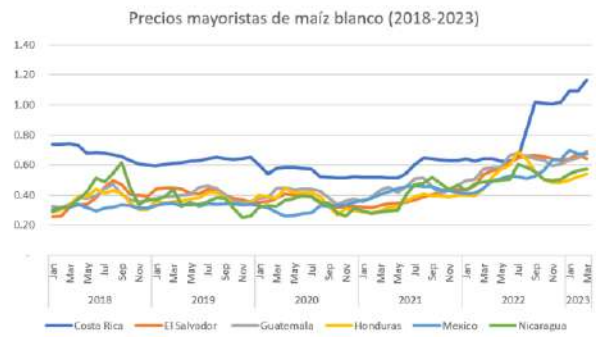
Gráfica 4. Evolución del precio del maíz blanco (US$/Kg)

Nota: 1/ Maíz blanco. ES, GT y NC en QQ (100 Libras); HN en sacos de 200 Libras; MX y CR en Kilogramos.